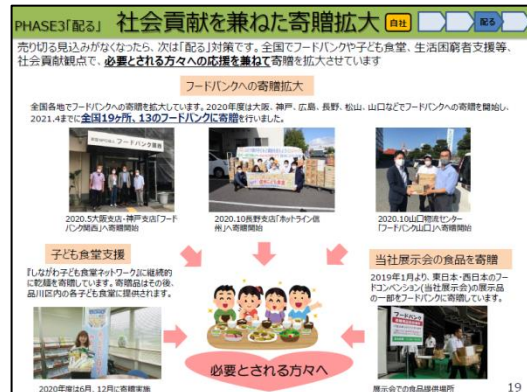
フードバンク等へ寄贈拡大